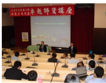
生醫科技學院講座