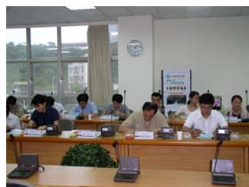
與會人員填寫回饋表