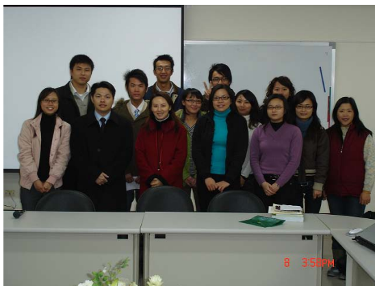
許所長、楊經理與經管所學生合照

此次活動對本校學生在技能訓練課程上及實務決策能力是受益良多，更有益於同儕之間互動及將來學業相互提攜，亦深信對學生將來不管是就業或者日後在修習相關課程助益甚大。