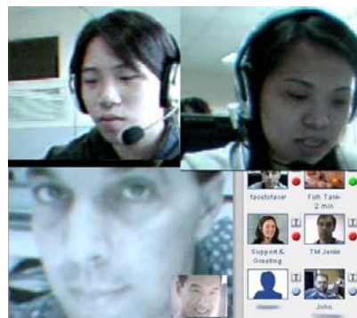
Composite picture taken from video conversations with students during project time