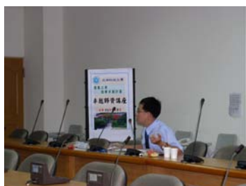
主講人與新進教師經驗談