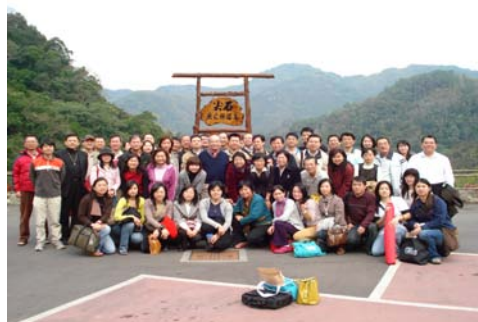
健康科學學院教師輔導知能研習會於 魚之鄉森林溫泉渡假村舉行