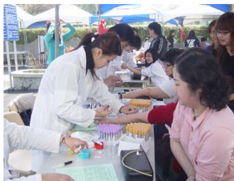
工作人員爲受檢者抽血

二、本中心於 3 月 1~5 日辦理教職員及學生實習前健康檢查，在此感謝所有的受檢人員全力配合以及工作人員的協助，使得本次活動圓滿完成。