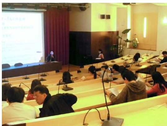
本校教師參與說明會一景