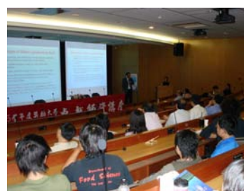
健康科學學院講座