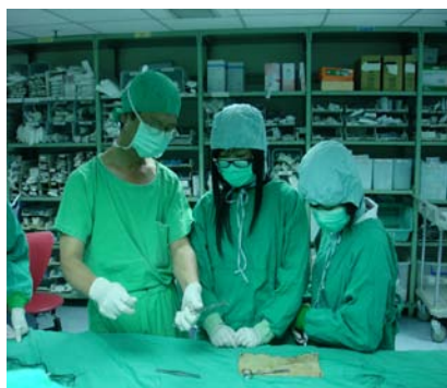
同學親自動手體驗開刀的縫合過程