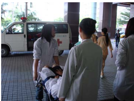
同學體驗救護車的搬運病人經驗與過程

本校於 96 年 11 月 17 日(星期六)06:50~17:00 舉辦「志工體驗營」活動，活動內容包含關懷生命體驗及參觀消防博物館兩項行程。第一站首先至台中大里綜合仁愛醫院，參加同學除接受急救技能訓練外，並參觀嬰兒室及產房、學習縫合技術及新生兒照顧等，讓同學體驗媽媽生產過程的甜蜜與辛勞。而後同學至新竹消防博物館參觀，實際演練濃煙逃生、緩降機使用、滑袋逃生等逃生技能，同學皆反應課程生動而活潑，具有正面意義，收獲良多。