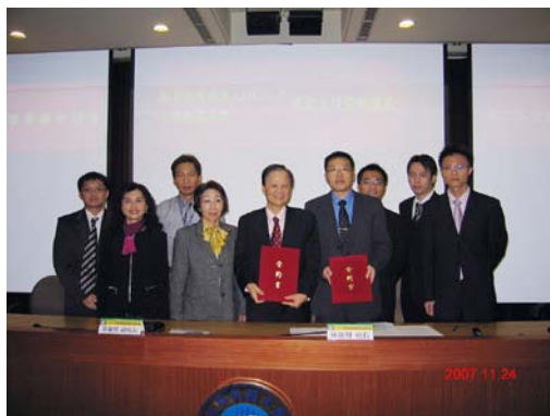
校長、副校長、研發長、管理學院溫院長與 錠律保險經紀人代表合影

本次研討會在健康科學組、生醫科技組、管理組及共同教育組等四組精彩的論文發表下，獲得一致好評，同學也讓所有參與者均滿懷收穫、歡喜而歸，為本次活動畫上完美的句點。