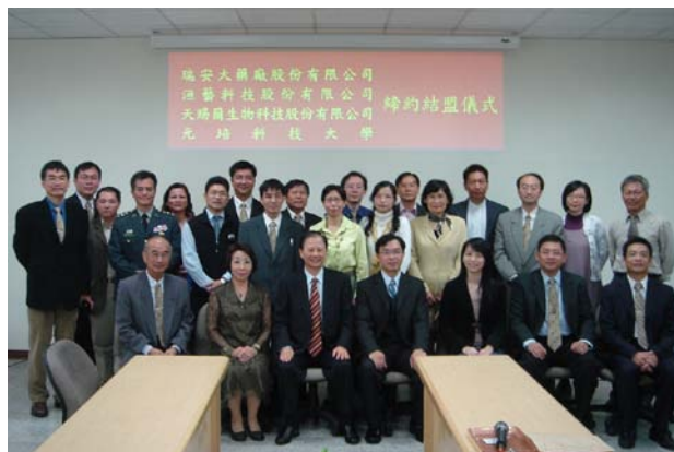
策略聯盟簽約儀式後，本校與會師長及貴賓合影留念

本校於 96 年 11 月 8 日邀請瑞安大藥廠股份有限公司、洄藝科技股份有限公司及天賜爾生物科技股份有限公司等貴賓蒞校與會參加揭牌儀式，並同時舉行締約結盟儀式，簽訂策略聯盟合約書，以促進雙方之產學合作，並共同輔導學生之實習與就業進路。