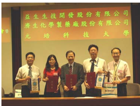
生物技術系與多家廠商建立策略聯盟