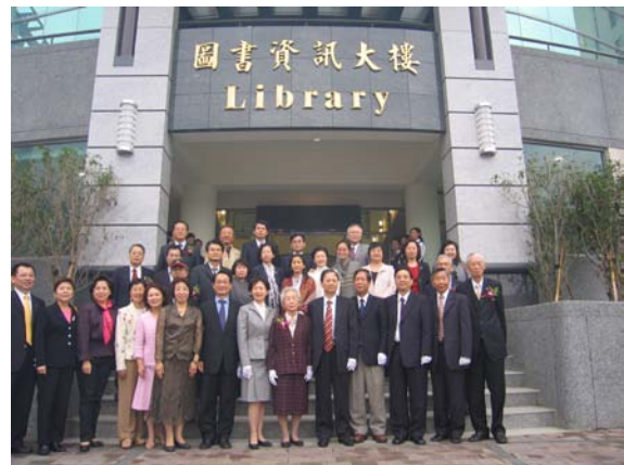
本校「圖書資訊及生物技術大樓」落成典禮與會人員合影