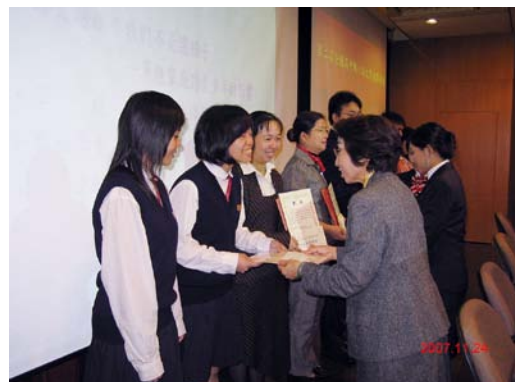
副校長頒獎給滿心歡喜的小論文 得獎學生