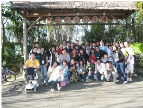
資源教室同學們造訪新竹縣峨眉鄉十二寮農園

資源教室於 96 年 11 月 25 日(星期日)，帶領資源教室的學生、IF 義輔社及教師造訪新竹縣峨眉鄉的十二寮農園，品嚐客家美食、製作客家麻糬及黃金菜包，充分體驗田園之樂。此外，透過這次戶外踏青的活動，師生們亦得以有機會徜徉於大自然的懷抱，享受湖畔漫步、風徐境幽的感受，雖然大伙兒走的香汗淋漓，但身心似乎也經過一番洗滌般的清澈。就在這享受美景、說說笑笑間，無形中增進了同學們之間的互動，美好的一天在歡笑中劃下句點。