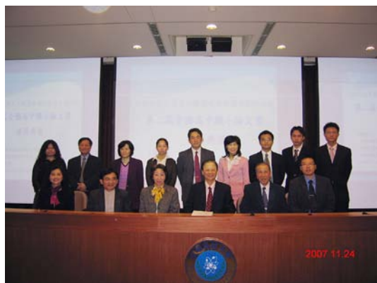
校長、副校長、管理學院溫院長 與貴賓合影