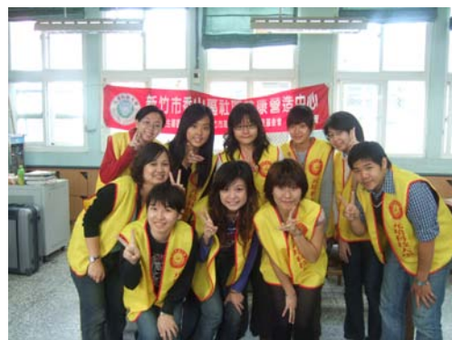
本校服務志工合影

本中心於 96 年 11 月 10 日協同惠群社前往港南國小，協助辦理「校慶暨社區健康總動員運動會」，提供血壓、體脂肪、骨質密度及一氧化碳檢測。總計本次活動有 79 位民眾參與，情況踴躍，並感謝多位惠群社志工熱情協助，使本活動順利圓滿完成。