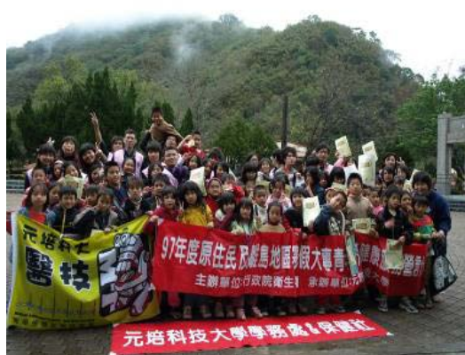
本校團隊與新樂國小同學合影

在偏遠原住民部落經濟、教育、衛生資源缺乏以及家庭結構等等問題情況下，同學們帶給部落男女老少無限溫馨，部落長老深表感謝，同時同學們的付出所獲得的寶貴經驗是無法用言語來形容的，永生難忘。