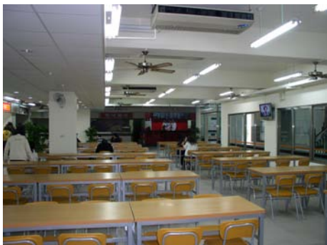
本校光恩樓地下室新裝潢完工的美食餐廳