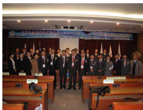
中、日、韓三國放射學會與會人員合影