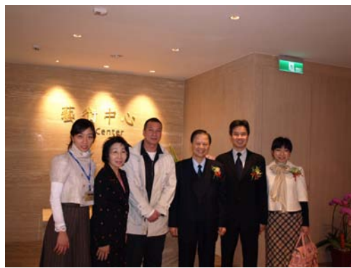
校長、副校長、光宇藝術中心黃主任 與參加貴賓合影