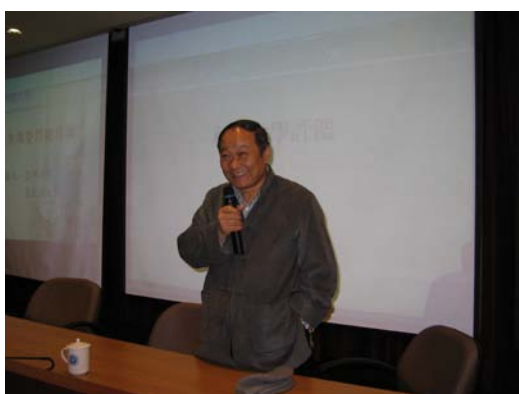
亞洲大學張紘炬校長蒞臨本校進行 專題演講

會中利用全校教職員參與研習會的契機與韓國延世大學簽訂未來合作模式，韓國延世大學與本校以醫學起家之背景相似，相信彼此的合作與交流必能激盪出更多的互動成果。本次研習會之主軸為招生與年底評鑑，會中首先請各系做該系之招生行銷簡報，各系代表在依序簡報中無不使出渾身解數來行銷該系之特色，以吸引高中職學生上門就讀。此外也很榮幸邀請到亞洲大學張紘炬校長為我們做年底評鑑的專題演講，演講中張校長暢談個人多年來擔任評鑑委員的經驗及元培未來接受評鑑時應注意的各種事項，內容鉅細靡遺，令在場所有教職員收穫滿囊。最後由校長、副校長共同主持宣誓及帶動唱活動，將本次以招生與年底評鑑為主軸的共識氣氛帶入最高潮。