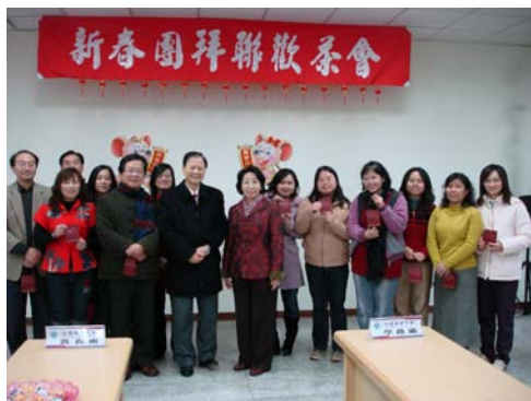
校長、副校長與獲獎同仁合影

而後本校準備紅包予生肖屬鼠的同仁，另副校長請同仁講出關於鼠的成語，答對者即可獲贈精美禮品，同仁們玩得不亦樂乎，整個茶會就在歡笑聲中圓滿結束。