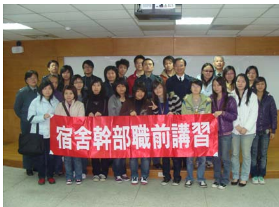
「宿舍幹部職前講習」與會 師長及同學合影

本校 96 學年度第 2 學期「宿舍幹部職前講習」於 97 年 2 月 22 日假文化教室舉行。活動中各宿舍輔導教官及幹部透過彼此經驗交流，加強幹部本職學能，生輔組並以案例宣導強化幹部緊急應變訓練能力。最後，研習活動在各宿舍輔導教官及幹部互道問候「新年好！」中順利圓滿結束。