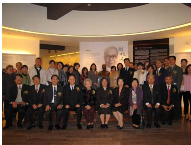
五樓校史館開幕儀式合影

元培科技大學校史館及光宇藝術中心於 97 年 2 月 22 日隆重開幕，開幕首展特別邀請李澤藩美術館展出近四十幅李澤藩大師畫作，為新竹地區兩大教育家元培科大創校人蔡炳坤，以及台灣第一代西洋美術畫家李澤藩的貢獻做見證；新竹市長林政則與許多教育及藝術界貴賓也熱烈參與。