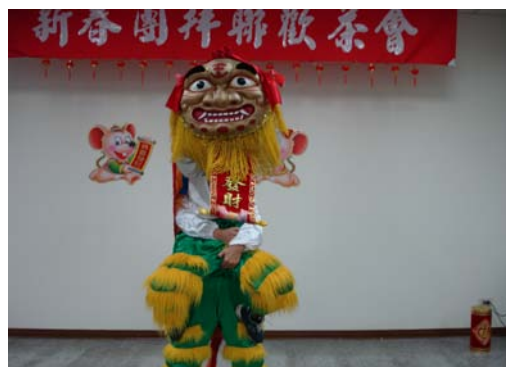
喜氣洋洋的祥獅獻瑞表演