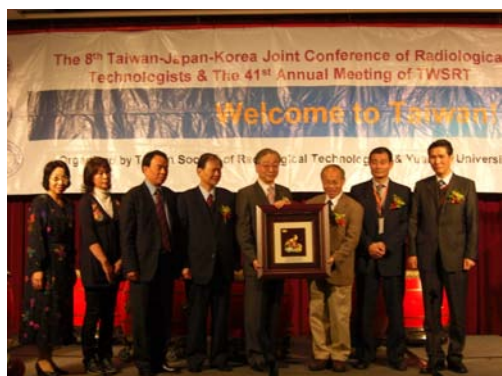
「中華民國醫事放射學會」致贈紀念品 予新竹市林政則市長以表達感謝之意

本次研討會議題概括理論與實務兩層面，除了邀請日韓學者發表有關放射師醫學養成教育，透過專題演講，介紹放射醫學領域之最新研究與論著外，並透過國際學術研討與經驗交流，提供國內外與會人員對於放射醫學領域之學術交流、技術應用等主題之最新發展趨勢與臨床應用新知。活動當天包括國內外放射師與國內放射相關科系教師、研究生等皆踴躍參與。