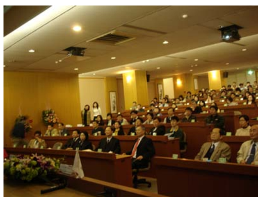
本校教學研習會教師聽講情形