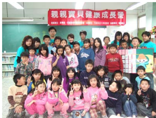
親親寶貝健康成長營活動合影

本中心於 97 年 1 月 21~23 日、97 年 1 月 28~30 日帶領本校惠群社、紅絲帶社同學分別於港南國小及內湖國小，辦理中小學教育優先區「親親寶貝健康成長營」、「健康一把罩學習營」活動，內容包含愛滋防治、安全急救教育、菸害防制等主題，共計 67 位小學生參加。活動採生動活潑方式傳達各項健康理念，深受港南國小校長及主任肯定，在此也感謝兩校家長會補助 5000 元經費來支持本活動。