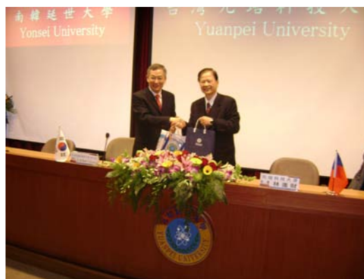
本校與韓國延世大學互贈紀念禮品