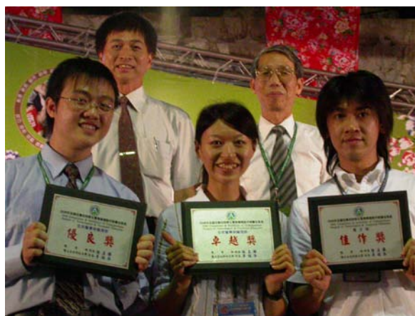
本校獲獎同學與教育部技職司張國保司長(左)、 台北科技大學李祖添校長(右)合影