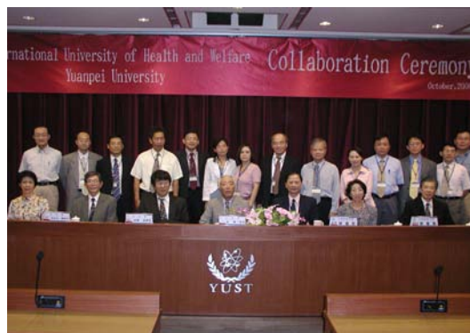
校長、副校長、單位主管與日本國際醫療 福祉大學校長、理事長等來訪貴賓合影