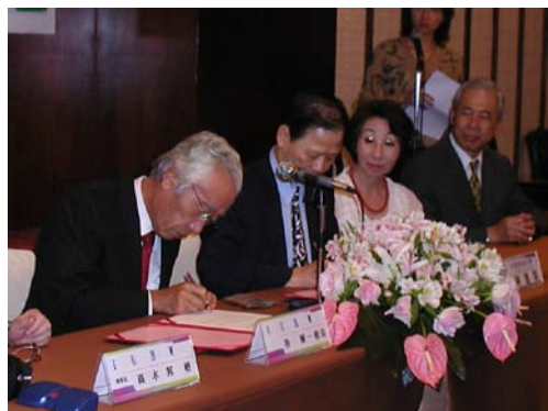
本校與日本國際醫療福祉大學 簽署合作協約

自從 2004 年 7 月，本校校長及副校長首次率領學校師長到日本國際醫療福祉大學(International University of Health and Welfare)參訪開始，歷經二年間頻繁的互訪及協商，本校與日本國際醫療福祉大學終於在 10 月 22 日簽署合作協約，為本校邁向國際化，拓展國際交流合作又添上新的一頁。IUHW 共有三個校區，分別為櫛木縣大田原校區、福岡縣大川校區及神奈川縣小田原校區，設置有保健醫療學院、醫療福利學院、藥學院、康復醫學院及醫療福利學研究科，學生共五千餘人，在日本享有很高的聲望。期盼透過這次的結盟，能促進兩校師生共同合作，分享經驗，不論是合作研究計畫、共同舉辦學術研討會、或是雙方老師的學術交流、學生的交換等等都能相互學習成長，同步前進！