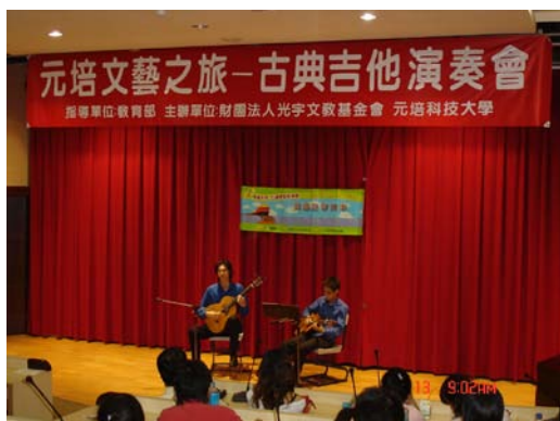
10 月 13 日舉辦之古典吉他演奏會 現場演奏情形

爲提昇本校藝文風氣，及配合「95 學年度教育基金會終身學習列車－美感教育列車」計畫，本中心承辦「元培文藝之旅－古典吉他演奏會」已於 95 年 10 月 13 日揭開序幕，當天參與情形非常踴躍，美妙的樂聲也讓前來聆聽的人意猶未盡。本中心並將陸續舉辦鋼琴演奏會(95 年 10 月 27 日下午 1:30 至 3:00)、文藝季作品展(預計 12 月 10-19 日)及藝術教學成果展(預計 12 月 19-23 日)，竭誠歡迎您的光臨！