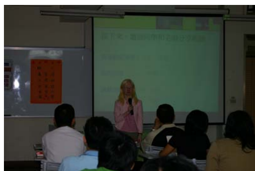
同學上台分享與資源教室互動的經驗