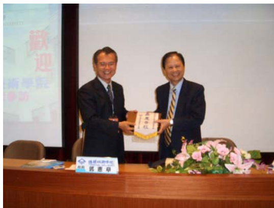
德明技術學院郭校長(左)贈送紀念品予本校，由本校林校長代表接受

參訪完畢，綜合座談期間，因兩校擁有專案評鑑及改大訪視的共同經驗，雙方人員互相分享經驗與甘苦，交流熱絡，由於德明技術學院以商管立校，其豐富的辦學經驗，亦給予本校管理學院相當多的啟發。在熱烈的互動中，因時間因素，在雙方校長互換紀念品下，依依不捨的結束。期許兩校賡續交流，共同成長，校誼永固，並預祝該校改名科技大學順利成功。