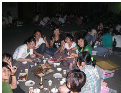
住宿生聯誼活動，參與同學踴躍

爲增進本校宿舍幹部與住宿生之情感交流，俾利彼此間各項事宜配合協調，本組特舉辦「住宿生聯誼活動」。活動分爲二個梯次，10 月 19 日下午 5 點 30 分爲菊苑、東苑、新苑幹部及住宿生聯誼；10 月 25 日下午 5 點 30 分爲竹苑幹部及住宿生聯誼，活動地點爲各宿舍場地，內容包括烤肉聯誼聚會及團康活動等，活動結束後即進行場地復原並返回宿舍晚點名。參加活動之同學皆反應良好，充分達到本活動凝聚宿舍成員向心力的目的。