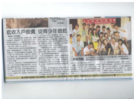
10 月 17 日中國時報竹苗焦點地方版報導