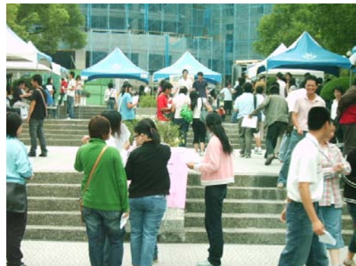
各社團使出渾身解數展現特色，吸引相當多同學到場參觀