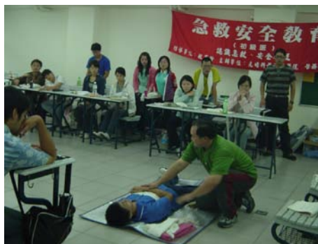
初級急救安全教育訓練情形

N109 教室舉辦，邀請到中華民國紅十字會新竹市支會教練群協助訓練，課程內容有急救概述、心肺復甦術、異物哽塞、創傷、包紮、休克及普通急症、中毒、灼傷和過冷過熱、骨骼關節肌肉的損傷、傷患運送(共計 16 小時)。活動報名 37 人，實到 36 人，通過 27 人，通過率達 75%。