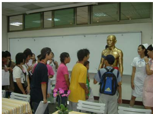
同學們參觀本校護理系實習教室

苗栗縣世界和平會本次主辦之大學之旅，主要是透過參訪活動，讓同學們更加了解各校之特色與發展，以激勵低收入家庭子女升學的動力。本活動於 95 年 10 月 17 日中國時報竹苗焦點地方版亦有相關報導。