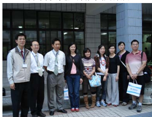
來訪之滬江高中教師與本校師長合影