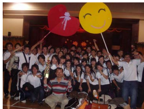
生技系喜奪新生盃合唱比賽冠軍，完成二連霸佳績

95 學年度新生盃合唱比賽順利於 12 月 6 日在光禧綜合大禮堂舉行，生技系同學悠揚的鋼琴和直笛伴奏，與同學優美的歌聲相互輝映，令人陶醉不已，亦不負眾望奪下冠軍，得到二連勝的佳績。會後老師除了感謝學長姐熱情的指導與同學辛勤的練習外，更期許明年能繼續努力拿下三連霸。