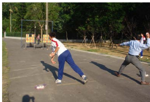
醫管系舉辦棒球九宮格比賽，由系主任及棒球隊指導老師開球