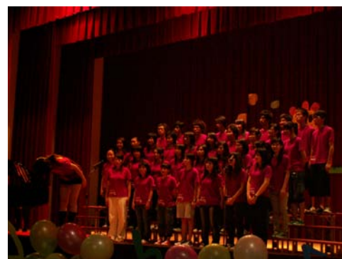
各系發揮團隊精神認真比賽情形