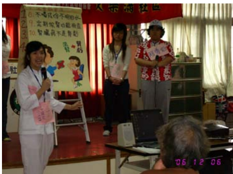
本校護理系同學進行成果發表