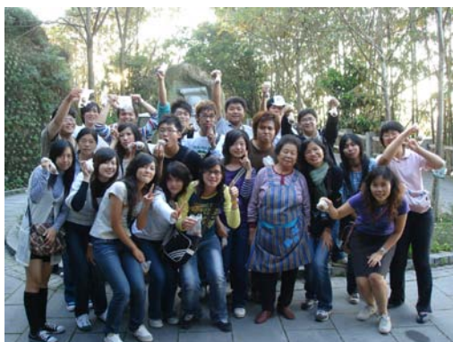
班上同學在日月潭玄光寺與賣了四十餘年茶葉蛋的辣嬾合照

東豐綠廊 單車逞豪強 石崗大壩記錄九二一的傷 日月潭的湖光映照我臉龐 辣嬾蛋的美味值得一嚐再嚐 清境山上 牧犬趕綿羊 藍天白雲之下 草原任徜徉 堅定的友誼隨風箏飛翔 化為銀鈴般的笑聲在山谷裡迴盪 箱根溫泉 特色在裸湯 害羞的我們勇敢袒裡相向 年少的你我曾如此瘋狂 深夜裡想起忍不住笑到天亮 那小小的通舖 鼾聲震天響 難得我們多人共睡一房 同枕眠的甜蜜帶我進夢鄉 煩惱全遺忘 台一賞花 埔里試酒量 廣興紙寮拓印功夫響叮噠 快樂的班遊瞬間收場 留下滿車的歌聲陪我微笑回想 幸福的旅程收穫滿囊 祝福我們班的情誼能夠地久天長