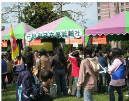
本校義輔社同學擺設之攤位， 吸引民眾駐足流連

本次社區服務為學生輔導中心與義輔社同學參與新竹家扶中心所辦的「暖冬慈幼園遊會」活動，當天一大早就到國立清華大學準備園遊會擺攤，第一次設園遊會攤子，老師與同學們都抱著期待與興奮的心情大喊著：「來玩遊戲哦～10 元玩 3 次！」每個小朋友都過關了，拿到可愛的獎品，人潮一直持續到下午接近尾聲仍久久不退；義輔社所有收入的費用全數捐給家扶中心，希望在寒冷的冬天裡，這場活動可以為家扶小朋友帶來更溫暖的冬天。學生輔導中心歡迎元培有興趣的同學加入我們義工行列，在期末預祝大家新年快樂。