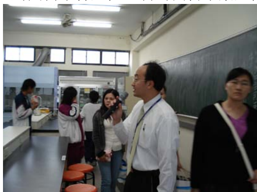
林主任帶領同學參觀食科系實驗教室