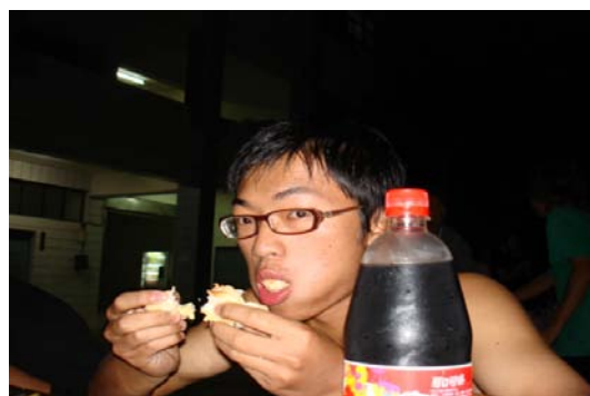
參賽同學賣力地狼吞虎嚥

餐飲管理系於 12 月 7 號晚上 6 點，在集賢樓一樓廣場舉行了一年一度的「大胃王比賽」。這次的活動有別於以往，推出了「吃得快」和「吃得飽」兩種遊戲來進行，讓許多吃不多的同學也能盡興！「吃得快」是由 10 個同學一組，一次一個人破相性的用完一道菜之後，用接力的方式進行比賽。而「吃得飽」是由 3 個同學一組，在指定的時間內，先吃完的獲勝。這次「吃得飽」菜單有冰淇淋、米粉、披薩、麵包、可樂、水餃、薯條、蘿蔔湯...等等！各組同學都使出了渾身解數，不管是塞了再說、還是超級大雜燴，果真是展現出餐管系對於吃的重視！而這次活動在系學會成員的精心策劃，和一年級的學弟妹熱烈的參與下圓滿的落幕，身與心皆滿載而歸！