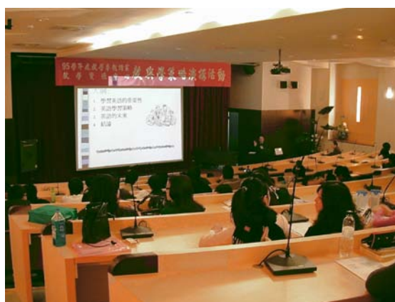
教學資源中心「教與學策略演講」現場聽講情形

因此，英語學習可以不再是效能不顯著的學科，更何況英語的實用性不只是用在溝通上，關於其他知識的學習以及擴展國際觀等等，影響甚廣。未來在我們學習英語時，應該不要僅再加強語調，像新加坡或美國那樣，讓英語發展成台式英語又何嘗不可呢？