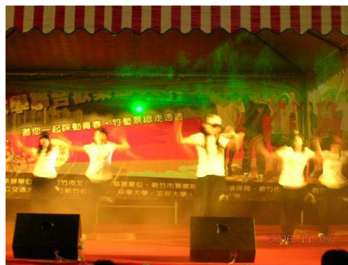
活力四射的熱音、熱舞社表演同學