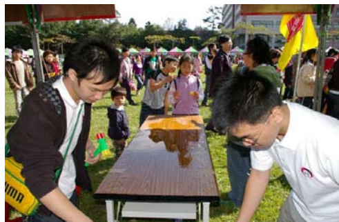
許多小朋友紛紛至本校攤位前玩遊戲