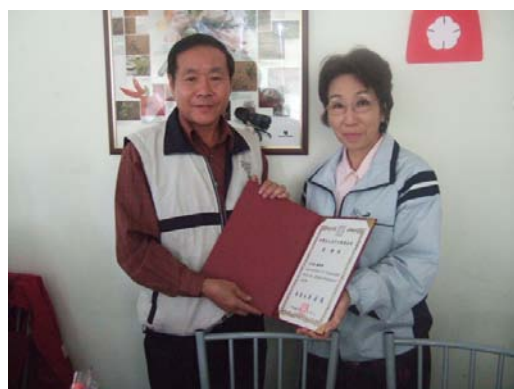
副校長頒發感謝狀予各社區代表