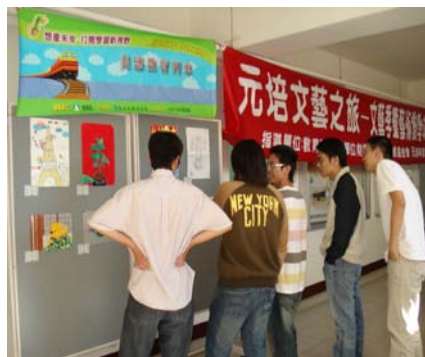
現場參觀同學討論展示作品

為提昇本校藝文風氣，及配合「95 學年度教育基金會終身學習列車－美感教育列車」計畫，本中心承辦「元培文藝之旅－文藝季暨藝術教學成果展」已於 95 年 12 月 8 日於光恩大樓四樓美術教室前揭開序幕，師生參觀情形非常踴躍。這次教學成果展充分展現同學們的藝術才華，也激發校園學習藝術風氣，提升對美學學習興趣，建立美的生活習慣。參與同學表示希望下次還有機會，能夠多多舉辦相關美學活動。