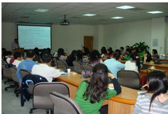
「95 學年度教育訓練公文課程」 同仁現場聽講情形

有鑑於公文書寫為行政人員辦理行政事務應具備的首要條件，也為了提昇行政同仁公文書寫品質之能力，本室特於 95 年 12 月 13 日(星期三)下午 14 時至 16 時假本校光暉 2 樓會議室辦理「95 學年度教育訓練公文課程」。本課程邀請到本校秘書室匡主任思聖來為我們演講，題目為「公文寫作之品質」。其課程內容包括公文及電子公文寫作與品質、公文定義與種類、電子公文、公文上簽之處理原則、提高公文寫作品質要領等，內容豐富實用，讓本校行政人員獲益良多。