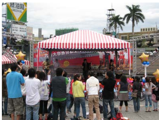
本活動於新竹火車站前舉辦， 吸引眾多圍觀人潮

相信透過此聯展之舉辦，同學們更能夠表達出新世代想法及創造力，把握學生青春勇敢時光，發揮表演藝術長才，以創造更多舞台機會與空間給積極參與表演之社團團體，提升城市音樂環境素質與多元想法。