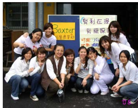
本次活動參與師生合影