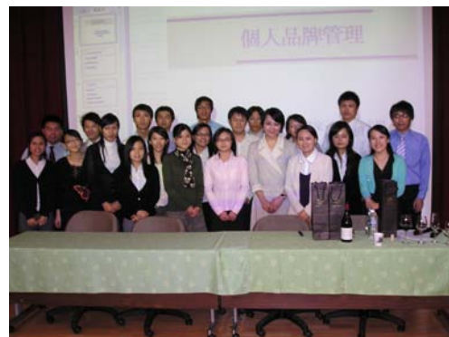
許所長、須副總與經管所學生合照

歡樂時光總是過的特別快，感謝紀總監遠道而來，帶來新知，亦感謝同學熱情參與，讓此活動圓滿落幕。此次活動對本校學生在技能訓練課程上及實務決策能力是受益匪淺的，更有益於同儕之間互動及將來學業相互提攜，亦深信對學生將來不管是就業或者日後在修習相關課程助益甚大。