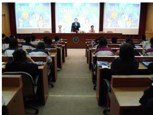
本校馬教務長(中)致歡迎詞， 左為食科系林主任，右為餐管系蔡主任

這場兩小時的知性參訪之旅，不但充分展現本校特色，同時也讓參訪學生進一步的瞭解餐管系與食科系的優勢與展望，相信透過此次的參訪，可讓同學們提早安排自己的生涯規劃。