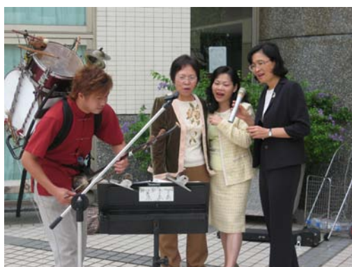
一人樂團表演，師長們高歌一曲

爲了喚醒客家意識，凝聚客家意志，並且共同致力傳統文化的傳承，本校特舉辦「永續傳承客家文化」活動，讓身爲現代人的學生們得以爲客家文化的傳承盡一份心力，並學習傳統導覽志工教育學習。本活動由企管系學會、學生自治會及學務處課指組共同舉辦，活動內容包羅萬象，包括講座、采風行(客家庄北埔、峨眉及獅頭山)及文化週系列(童玩 DIY、古式弓箭體驗、人形剪影及一人樂團表演)等，吸引相當多同學熱情參與。