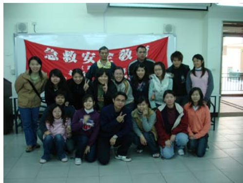
「高級急救人員訓練班」參與人員合影

本校分別於 95 年 12 月 2-3、9-10、16-17 日 8:10~17:00 假光恩大樓 N107 教室舉辦「高級急救人員訓練班」課程。活動邀請到中華民國紅十字會苗栗市支會、台中市支會、新竹市支會高級急救教練擔任課程講師，課程內容豐富，包括安全教育與急救概述、人體構造、急救箱的使用及敷料的製作、特殊創傷、休克、人工呼吸、心肺復甦術、水上安全與救生、包紮法、過冷與過熱的影響、輻射傷害、普通急症、中毒、特殊骨折、車禍急救、傷患運送、火災防護與逃生、颱風及地震的認識、緊急接生(共計 42 小時)等。本次參加者共計 16 名，通過測試者 16 名，錄取率 100%。