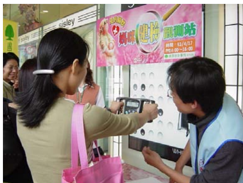
媽咪健檢觀測一景