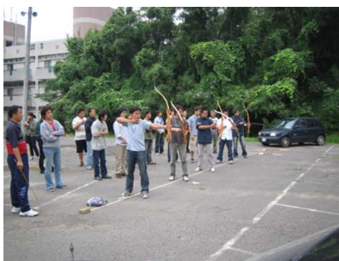
系際盃射箭比賽一景