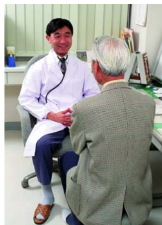
醫師親切地與老人 互動交談

希望藉由本活動的進行，能落實老人福利社區化、加強社區自我照護、自我成長，以達成社區營造之主要目標。