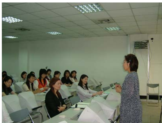
副校長蒞臨會場嘉勉同仁

本校已於九十三年四月廿八日(星期三)上午十點至十二點於光字大樓 A302 電腦教室舉辦電腦教育訓練『網頁製作』課程，活動當天報名人數相當踴躍，各單位報名上課的行政同仁高達 45 位，而副校長亦臨會場嘉勉同仁，會中除感謝諸位同仁能利用寶貴時間來學習現代化的新知外並鼓勵同仁們日後有類似活動也應多多參與，所謂「活到老學到老」如此才不會被新的 e 世代、新社會所淘汰。