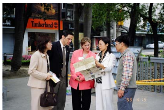
兩位外賓參觀新竹市歷史古蹟留影