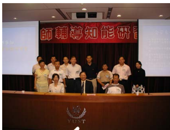
校長、副校長於教師輔導知能研習會中表揚績優導師