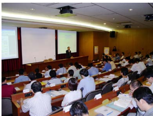
教師研習會在校長致開幕詞後展開

爲改進教師教學方法以期達到優質化的教學品質，本校特於 9 月 5 日假光恩大樓國際會議廳舉辦教學研習會，研習會在校長致開幕詞後展開。會中除教務處及其他行政單位進行業務報告及宣導外，另邀請到元智大學工業工程與管理學系張百棧教授及建國科技大學電子工程系羅榮村教授等具教育專長之學者專家蒞校做專題演講與指導。並藉由與會學者和教師的經驗傳承，讓本校教師能獲得啓發以便對往後的教學工作有所助益。此外尚利用分組座談的方式，讓全體教師對大學課程教材的網路化及遠距教學等相關問題提出進一步的討論。歷時約八個小時的研習會圓滿結束，亦爲本校全體教師拓展新的教學思維模式。