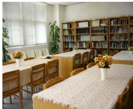
圖書館 4 樓溫馨怡人的參考區