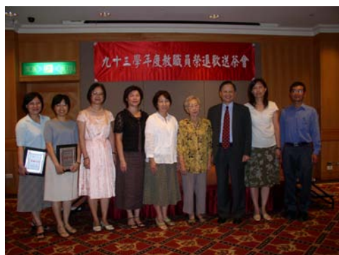
官董事長及校長、副校長與榮退教職員 合影留念

最後，在董事長、校長、副校長等人頒發榮退禮品以及獎牌表彰榮退人員對學校的貢獻後，大家一同享用茶點。就這樣，我們在濃郁的茶香及悠揚的樂曲聲中，伴隨著他們的故事細細品嚐。