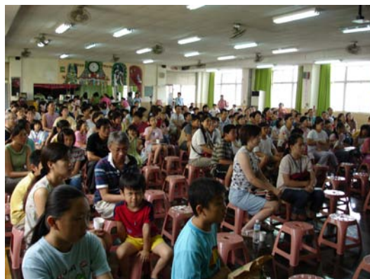
小朋友踴躍報名上課的情景