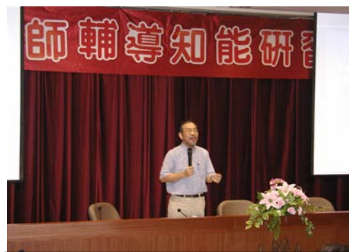
台大社會系孫中興教授演講情形

爲提昇教師及導師輔導知能，學生輔導中心於 94 年 9 月 6 日（星期二）舉辦教師輔導知能研習會及導師會議。教師輔導知能研習會由校長主持，會中除頒發 93 學年度績優導師外，並邀請到萬能科技大學劉易齋學務長主講「身心靈的統整與發展」及台灣大學社會系孫中興教授暢談「性別平等教育法的立法用意與實施經驗」，兩場演講與會的老師聽得如痴如醉，笑聲連連，深受好評。下午的導師會議則安排靜宜大學青少年兒福系的李郁文教授主講「輔導原理與務實」，會中精彩的演講及精闢的立論，使得導師們獲得更多的輔導技巧。