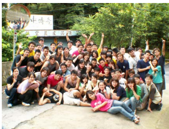
熱情活力的「暑期幹部研習營」參與同學

這三天的活動下來大家都收穫與成長許多，也讓我們了解到成就一件事情需合作、合心、團結力量大的原理。也使各社團與各系學會的許多幹部們互相認識與往來，使彼此的感情更加熱絡。