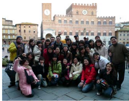
義大利著名山城－西恩納古城