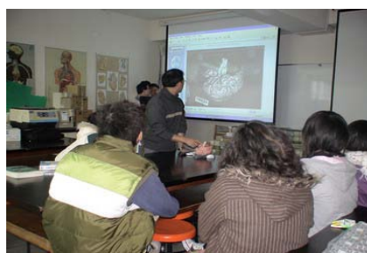
(圖五)模擬上課情況測試解析