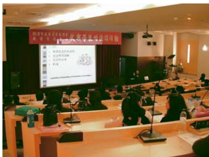
(圖一)學習策略演講

「元培科技大學基礎學科課後輔導實施辦法」在 95 年 11 月 14 日通過教學卓越計畫進度說明會議。95 學年上學期，共有 7 位教師申請，通過班級數為 9 班，上課時間為 95 年 12 月至上學期結束。課後輔導課程實施的精神在於為了提升本校各學系學生基礎學科學習之成效，由教師提出申請。課後輔導班級以學生 8 至 15 人為開班人數，以小班制教學以提升教學質。截至目前課程實施滿意度問卷回收結果得知，教師對學生學業成績表現、學習態度等多認為是有進步的肯定表現，且對於課後輔導實施以肯定支持的態度。另外，在學生方面，學生皆同意課後輔導課程的小班教學能幫助提升學習成效。由教學卓越計畫之推行，教學資源中心訂定「元培科技大學 基礎學科課後輔導實施辦法」並推行課後輔導制度之運作，非常感謝本校教師在課後為學生的付出，希望未來課後輔導制度能繼續為學習成效較不佳的學生提供服務。