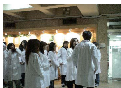
(圖三)參觀大體解剖