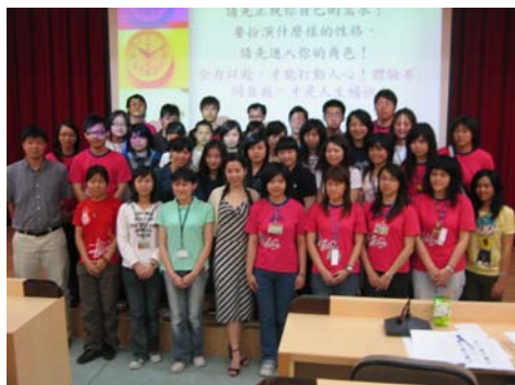
全體學員留影紀念

透過元培親善大使暨領袖人才培訓營，安排精采課程，結合理論與實務演練，培養學生正向積極的價值觀，從認識衣著禮儀、禮儀訓練，並規劃貴賓接待的經驗分享到實際操作，模擬會議及接待貴賓，心靈震撼，透過學生領導人才培訓課程，教導學生學習問題解決、情緒管理與增強挫折忍受度，強化學生的自我管理能力。本活動於 3 月 31 日假本校光禧國際會議廳以講座互動的方式舉行，4 月 1 日則開拔至南投日月潭青年活動中心以團體動力及自力造筏的方式進行培訓活動，本次活動主要是讓同學體會團體合作的重要性，身為一個領袖人才，不只要展現個人領導特色，更要結合整體團結合作的精神，才能建立起正確的領導人價值觀。本活動過程圓滿順利，同學回味無窮。