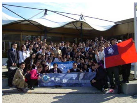
餐飲管理系全體學生於洛桑學校合影

抵達巴黎後，我們搭乘【塞納河遊船】欣賞花都兩岸風光與建築，並特別安排登上著名的【艾菲爾鐵塔第二層】俯瞰巴黎不同凡響的絕美景緻。到法國當然要去參觀法國最著名的【羅浮宮】與【凡爾賽宮】，驚豔絕世的文化藝術饗宴，讓我們猶如置身在瑰麗的中古世紀歐洲時光中。而法國香檳區酒廠【Moët Et Chandon 酒廠】更是餐管系同學不可缺席的參訪行程，在此不僅有專人解說香檳酒的完整製造過程，更可親身品嚐與感受那香檳的魅力。而最吸引人的高檔法國【Fauchon 美食舖】我們更是不會錯過，那精緻美味的各式甜點，至今還令人難忘。此趟海外參訪之旅，全程安排美式早餐，並搭配歐洲當地最具特色的風味餐點，讓同學們可品嚐到各國最道地的美食饗宴並親身體驗豐富的歐洲餐飲文化。