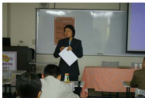
孟瑛如教授演講情形

資源教室於 96 年 3 月 14(星期三)為本校的身心障礙學生及其家長、導師舉辦了一場專題講座，主題是『認識身障生：如何與身障生相處並協助其學習』，講座中邀請新竹教育大學特教系權威--孟瑛如教授蒞臨指導，孟教授以淺顯易懂又幽默風趣的方式演說，讓講座中將近 40 位的師生皆收穫良多、意猶未盡。