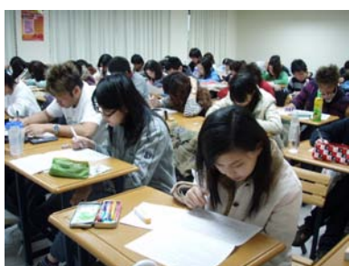
(圖一)基礎醫學會考