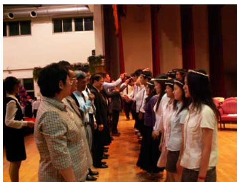
校長及本校師長為同學加冠