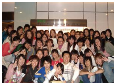
(圖六)佳生公司合影