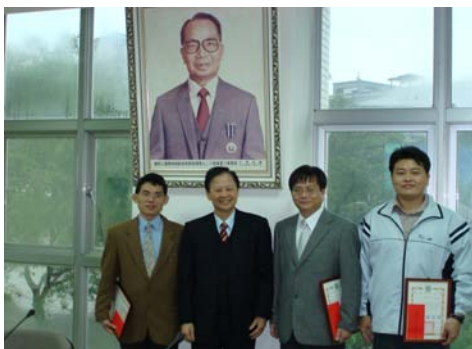
校長與三位通過升等教師合影