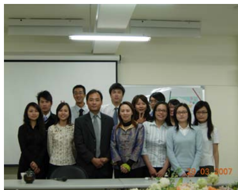
許所長、王理事長與經管所學生合照

此次活動對本校學生在技能訓練課程上及實務決策能力是受益良多，更有益於同儕之間互動及將來學業相互提攜，亦深信對學生將來不管是就業或者日後在修習相關課程助益甚大。