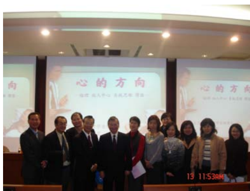
石曜堂理事長與本系教師合影留念