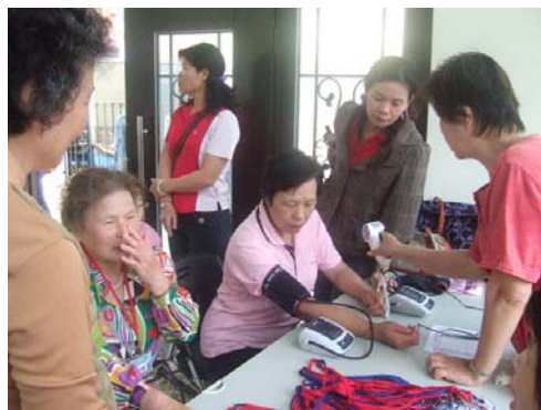
志工們為參加民眾作血壓測量

本中心協助朝山社區發展協會成立社區健康關懷站，並於 3 月 31 日辦理開幕式，共有 50 名民眾報名參加，以及 10 名志工加入服務的行列，本中心將持續給予支援各項課程以及協助輔導其志工，當下王理事長表示：本校對社區的幫助與支援給予相當的肯定。