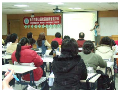
參加人員認真上課之情形

健康管理中心分別於 3/19、20、21 辦理志工基礎訓練以及 3/26、27、28 辦理志工特殊訓練，本次共計 22 位同學及社區民眾完成所有訓練課程，並可領取志工服務手冊，本中心將協助輔導其至各社區中服務，以落實本校致力於社區服務之精神。