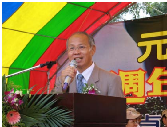
新竹市林政則市長親臨會場致詞

在校內舉辦校慶運動會，不必向外地租借運動場地，著實讓學生有親切感與認同感。麻雀雖小，卻是氣氛感人而融洽，整體活動內容亦不亞於過去在香山運動場的活動。會中除有各項運動競賽及啦啦隊表演外，並舉辦健康義檢義診活動與香山社區健康營造各項表演。本次大會得以成功，都要感謝全體同仁的努力，使大會更加圓滿。