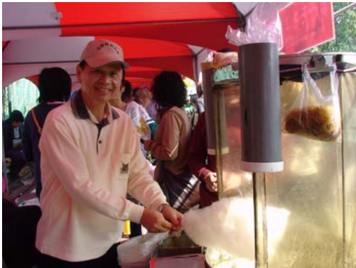
校長體驗 DIY 棉花糖

此次活動內容豐富多元，包括了各系及學生社團的創意攤位、各式客家傳統 DIY 的體驗攤位。舞台上由學生自治會帶來的櫻桃小丸子舞蹈表演、熱音社的組曲、熱舞社的組合舞曲、跆拳道社的擊破、國樂社的音樂演奏、靜思社的手語表演、芎林客家歌謠團的傳統客家歌謠、北門國小的太極拳表演及逆飛輪小朋友的直排輪表演；下午 1 時更有卡拉 OK 決賽。舞台上除了各節目表演外，也不時穿插與學校師生互動的摸彩活動，當天雖然冷風颼颼，卻掩蓋不住大家的熱情。