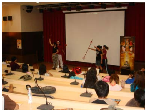
台下觀眾初體驗－耍槍表演