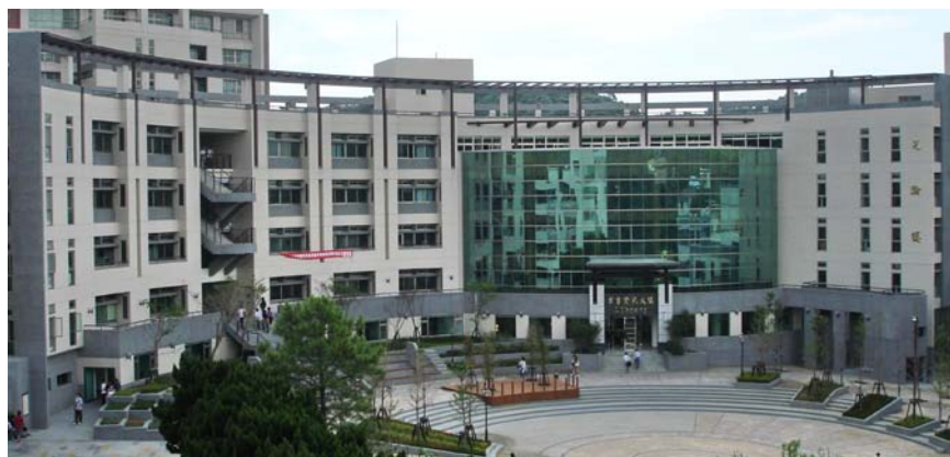
本校新完工之圖書資訊暨生物技術大樓廣場

圖書資訊暨生物技術大樓廣場，為校園心臟地帶，地點非常重要，大喬木景觀公司規劃之初，即以學校校園功能需求，配合周邊建築物地形改造重建，以校園綠意美觀及水為設計重要元素。該廣場為晨曦大道軸線延伸，廣場設計以圓型幾何線條為設計主軸，由廣場中心向外擴展，廣場緊接建築物周邊設計一階一階的花台，含有步步高升之意，廣場鋪面採用排水佳之透水磚，增加廣場排水功能，迎賓水池與景觀壁泉具有降低周邊溫度功能及生生不息涵義，廣場階梯設計許多木作椅，可提供師生鳥語花香之休憩空間。另為學生著想，於夜間主要動線設計 LED 燈，增加學生夜間行的安全，廣場設置有大型照明燈具，可提供學生日夜表演活動空間。有鑒於廣場需有特殊又能代表學校創校理念之標的，特邀請雕塑藝術大師楊柏林於迎賓水池上，設計「生命天際」雕塑乙座，惟創作需要時間，目前正加緊製作中，預計於 96 年 12 月份完成，屆時圖書資訊暨生物技術大樓廣場將猶如畫龍點睛般，展現本校充沛的活力，請大家拭目以待。