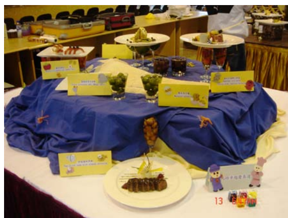
本校同學得獎作品「元培卓越慶奧運」