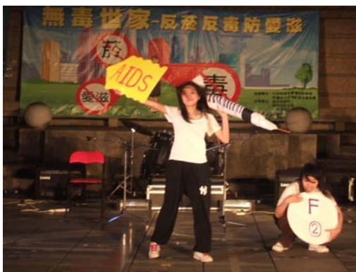
本校熱舞社帶來反毒、防愛滋 熱舞表演

據研究顯示吸菸、吸毒以及感染愛滋的比例有明顯年輕化的趨勢，為提升社會大眾對於菸害、毒品和愛滋病的認知，結合大專院校以及社區團體共同傳達反菸、反毒、防愛滋的訊息，本校健康管理中心於 96 年 10 月站前廣場辦理「無反毒、防愛滋活動」，會、紅絲帶社、惠群社共同協助辦理。活毒、防愛滋熱音、熱檢測、撿菸換保險邀請愛滋感染者現身做宣導。