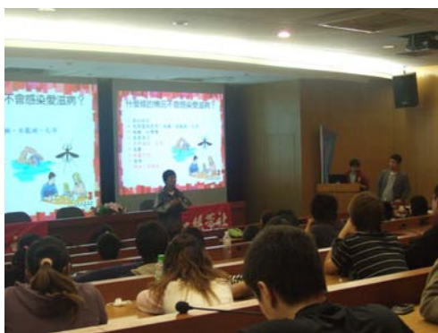
同學熱情愛滋防治講座

另為使全校師生對於愛滋病防治能有更深入的認識，健康管理中心與台灣愛滋被單協會於 96 年 10 月 15~29 日於本校圖書館前室內廣場，共同辦理「愛滋被單展活動」，讓參觀的人了解每件愛滋被單背後都蘊含一個故事。