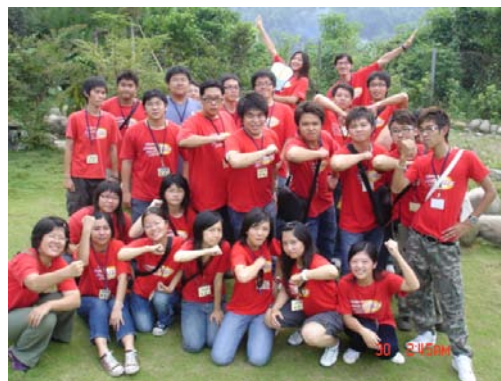
熱情活力的資管系迎新活動

本系於 9 月 29 日-30 日假雲林縣古坑鄉，系學會幹部們成功舉辦一場迎新活動。此次活動每個幹部成員們都兢兢業業準備，一次次開會、演練，忍耐著長時間疲憊和練習所受的傷和挫折，只為了讓新生們了解到資管系學長姐的熱誠和活力。雖然仍有美中不足的地方，但學會幹部們經過一次次的磨鍊考驗，未來辦理系上活動也將會一次次更進步。也希望他們盡心盡力辦理活動，能夠讓更多同學參與並得到更多同學們稱讚。