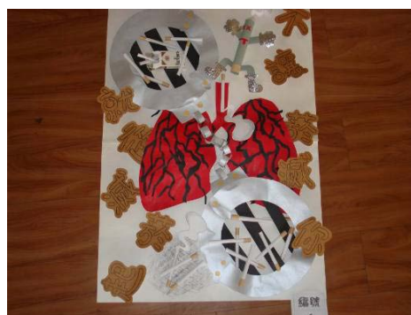
春暉海報設計競賽得獎作品