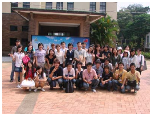
研習會之竹塹采風行—參觀新竹玻璃工藝館