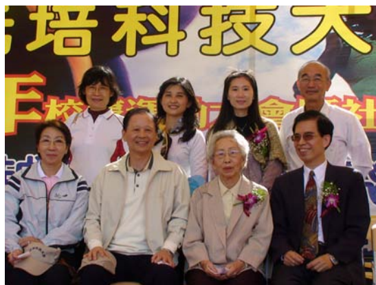
官董事長、校長、副校長與貴賓、 校內教師合影