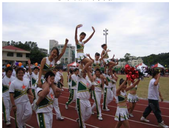
放射技術系熱情活力的進場方式