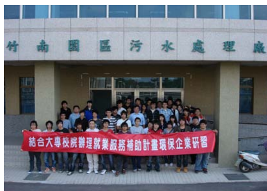
環衛系辦理之「環保企業研習」 活動剪影

本系 96 學年度第 1 學期「環保企業研習」已辦理完畢。分別於 10 月 16 日參訪八里污水處理廠、八里垃圾焚化廠及八里垃圾掩埋場；10 月 18 日參訪金益鼎企業股份有限公司、台灣菸酒股份有限公司竹南啤酒廠及科學工業園區竹南基地污水處理廠；10 月 18 日參訪新竹市環保局垃圾資源回收廠。主要是希望藉由企業人員的解說及實地參觀運作情形，讓同學能將理論與實務相對照結合。