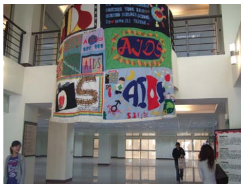
愛滋被單展覽活動