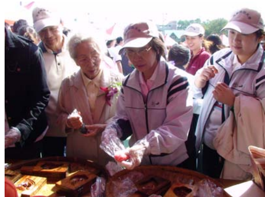
董事長及副校長體驗 DIY 客家點心紅龜粿