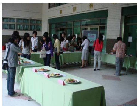
同學參觀創意餐點