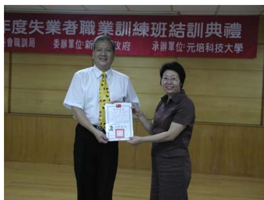
新竹市勞工局局長頒發結訓證書

今年暑假由新竹市政府委託本校辦理失業者職業訓練，「中餐訓練班」、「中式點心暨地方小吃訓練班」與「調酒飲料訓練班」分別已於 8 月 11 日、19 日舉行結訓典禮。在結訓典禮的過程中，新竹市政府勞工局局長給予學員們最大的鼓勵，期望經過 120 小時的技術培訓，可以提升學員們就業與創業的競爭力。長官們的精神喊話，是提升學員們精神層面的力量，學員們更以自己努力學習的豐碩成果來回應大家的期望。