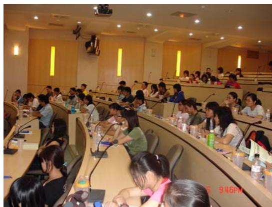
「元培青年領袖訓練營」同學上課情形

在元培進入新時代的此刻，生輔組自許勿忘創校人理念，辦理學生培訓活動，冀望能在競爭激烈的社會環境下，培養出新一批能夠立足台灣，放眼國際的優秀青年。