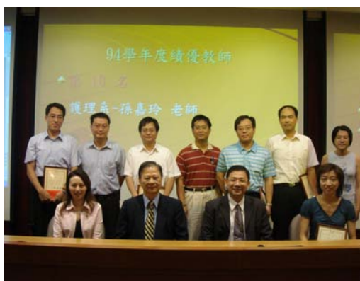
校長、教務長與 94 學年度績優教師當選人合影