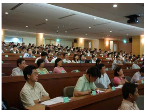
教學研習會中教師認真聽講情形

為改進教師教學方法以期達到優質化的教學品質，本校特於 95 年 9 月 5 日假光恩大樓國際會議廳舉辦教學研習會，研習會在校長致開幕詞後展開。會中除教務處及其他行政單位進行業務報告及宣導外，另邀請到台灣師範大學特殊教育學系潘裕豐教授及經濟部智慧財產局張仁平科長等具創造力專長之學者專家蒞校做專題演講與指導。並藉由與會學者和教師的經驗傳承，讓本校教師能獲得啟發以便對往後的教學工作有所助益。此外尚利用分組座談的方式，讓全體教師對大學課程教材的網路化及遠距教學等相關問題提出進一步的討論，為本校全體教師拓展新的教學思維模式。