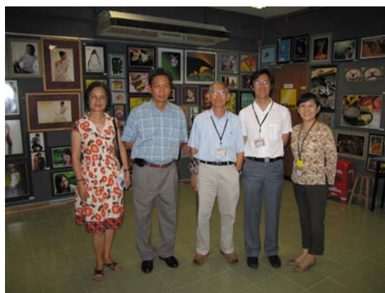
研發長等人參訪新紀元學院媒體藝術系