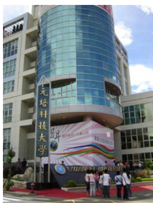
嶄新活力的元培科技大學， 正式邁入新的里程碑

日後本校亦將配合國家社會發展需要，規劃設置醫療福祉學院，學校仍將延續創校時「關懷健康、珍惜生命」的理念及發展「綠色生醫、預防保健與健康管理」的特色，朝「教學資訊化」、「研究卓越化」、「校園優質化」與「發展國際化」的優質科技大學邁進，培育人文與專業素養兼具的高素質人力。