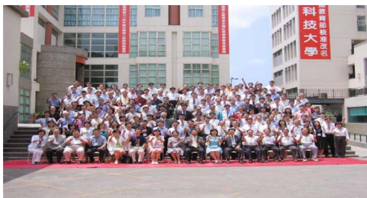
全國學務長於本校大合照