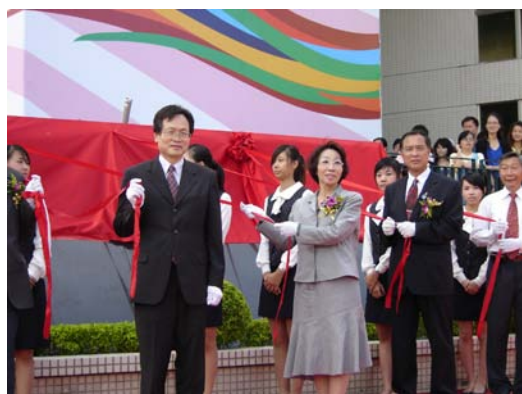
蔡副校長及董事、國內外貴賓們 拉開紅絲帶揭牌