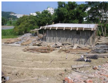
生活污水處理廠工程進度圖

鋼筋工程、生物技術大樓 5 樓立柱筋及組模工程，工程進度約完成 55%。另生活污水處理廠(土木建築及機械設備)工程進度約完成 45%。