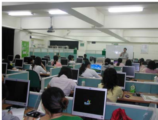
「在職人員疾病分類訓練班」 第一天開訓上課情形

本系於 95 學年度與行政院勞委會職訓局合作辦理「在職人員疾病分類訓練班」，為期五週，共計 60 小時。由於桃竹苗地區醫療機構的相關專業從業人員報名相當踴躍，已於 9 月 14 日正式開班上課，預計於 10 月 12 日結訓。這些學員於結業之後，將於 10 月下旬參加「疾病分類」專業人員考試，在此預祝學員們都能順利通過考試，取得「疾病分類」專業人員證照。