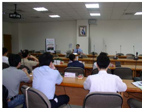
「新進初任教學教師講座」 鼓勵新進教師邁進教育之路

講座中提及教學準備包含課程準備、研究計畫、實務研習、專業證照等豐富的經驗分享，並漫談教學卓越方向及探討教師自我評量等多面向的議題，藉此鼓勵新進教師邁進教育之路，讓新進教師對往後的教學工作受益良多。