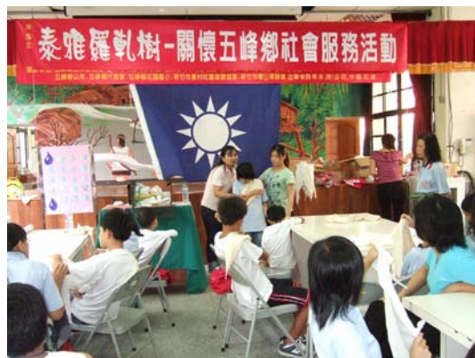
本校人員現場示範急救方法 教學情形

本中心帶領本校惠群社同學於 95 年 8 月 14 日至 18 日，協同中國國民黨中央委員會、新竹市婦女會香山支會、香村里辦公室、香村社區發展協會等，至新竹縣五峰鄉花園國小辦理「泰雅羅軋樹—關懷五峰鄉社會服務活動」，提供認識急救方法課程教學。本校人員運用生動活潑之上課方式，在短時間內增進同學們對創傷處置之應變能力，對同學們助益良多，獲中國國民黨中央委員會頒發感謝狀一只。