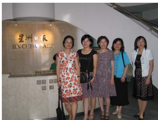
教學團隊接受馬來西亞最大華文媒體—星洲日報專訪

匆匆的 19 天馬來西亞教學之旅，帶滿豐富的行囊與回憶回來，在被感動後的激情還盪漾時，寫下這簡短紀事，希望這短短的行程簡介，能激起同儕們的熱情而參與，一起灌溉另一個元培校外園地—馬來西亞新紀元學院，讓「國合案」永續經營下去。