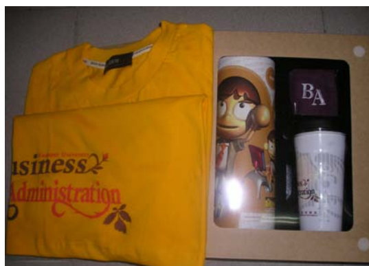
精緻的企管系新生禮盒

為讓企管系新生能更熟悉本系及校園環境，於 8 月 25 日舉辦新生說明會，當天參與之新生及新生家長非常踴躍。會中系主任透過簡報方式詳細介紹本系概況，並在系學會同學帶領下參觀校園周邊環境。此外，本屆企管系學會特別製作了一份精緻的新生禮盒提供給每位新生，禮盒的內容包含企管系服務生(T 恤)一件，隨手杯一個，護腕一個，象徵企管系的創新、活力與關懷。