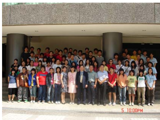
校長、長官們與「元培青年領袖訓練營」同學合影