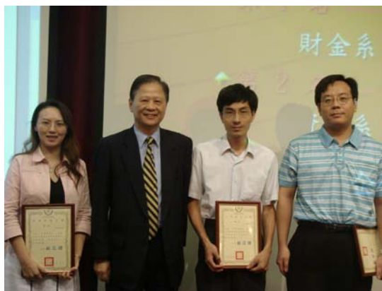
校長與 94 學年度學生考取專業證照績優系所主任合影