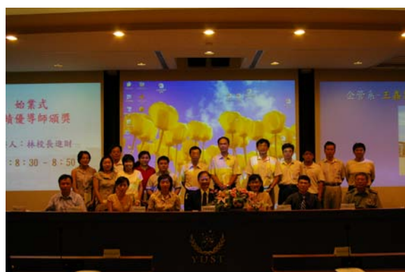
校長、學務長於教師輔導知能研習會中表揚績優導師