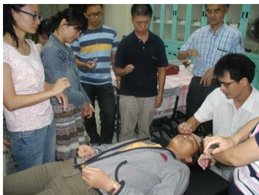
福建中醫學院何醫師講授時，同學們認真學習之情形