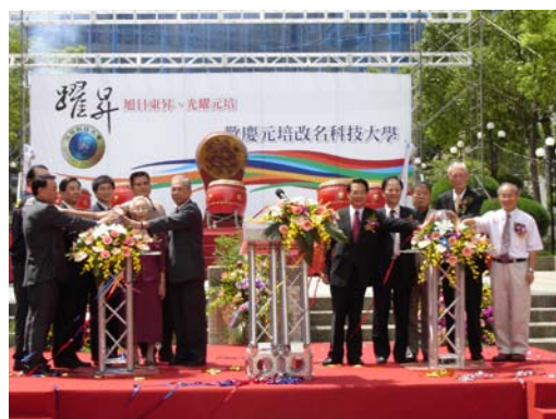
張司長、林市長、官董事長、校長 及多位貴賓啟動水晶球揭牌