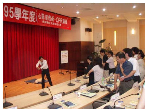
「新進教職員心肺復甦術訓練」 測驗通過率 100%