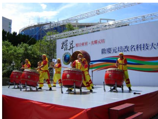
「鑼鼓喧天、威振四方」的太鼓祈福 揭開典禮序幕